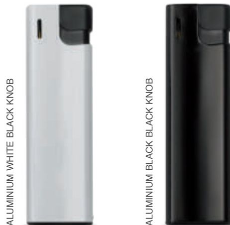
10919 EB-19 Aluminium 01