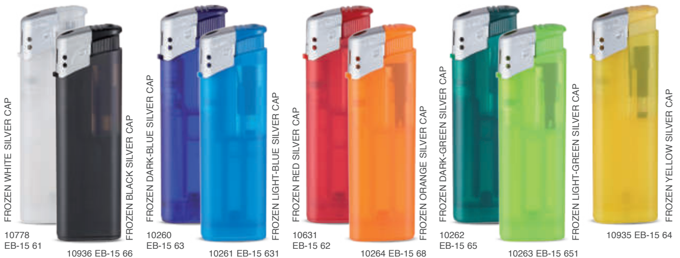
FROZEN WHITE SILVER CAP