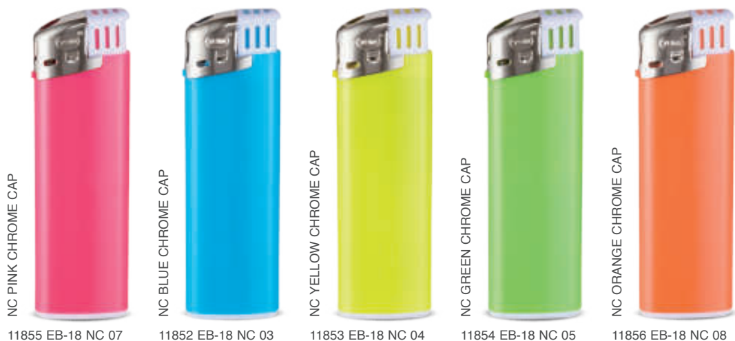
NC PINK CHROME CAP