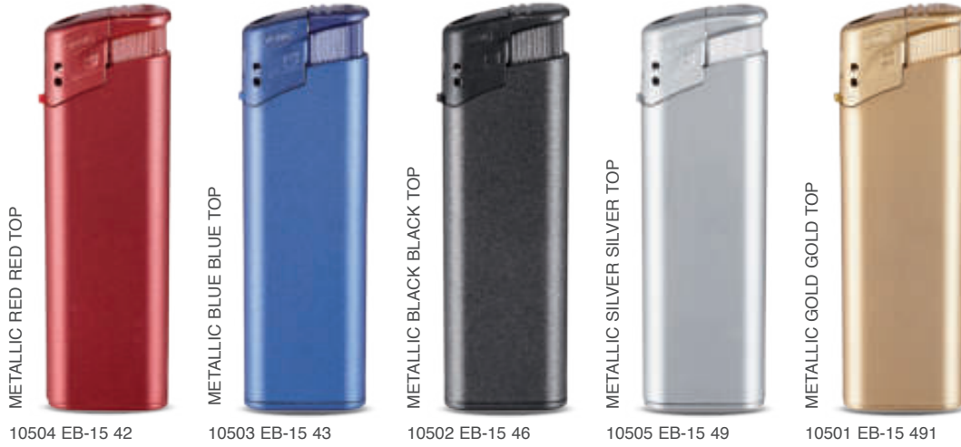
METALLIC RED RED TOP