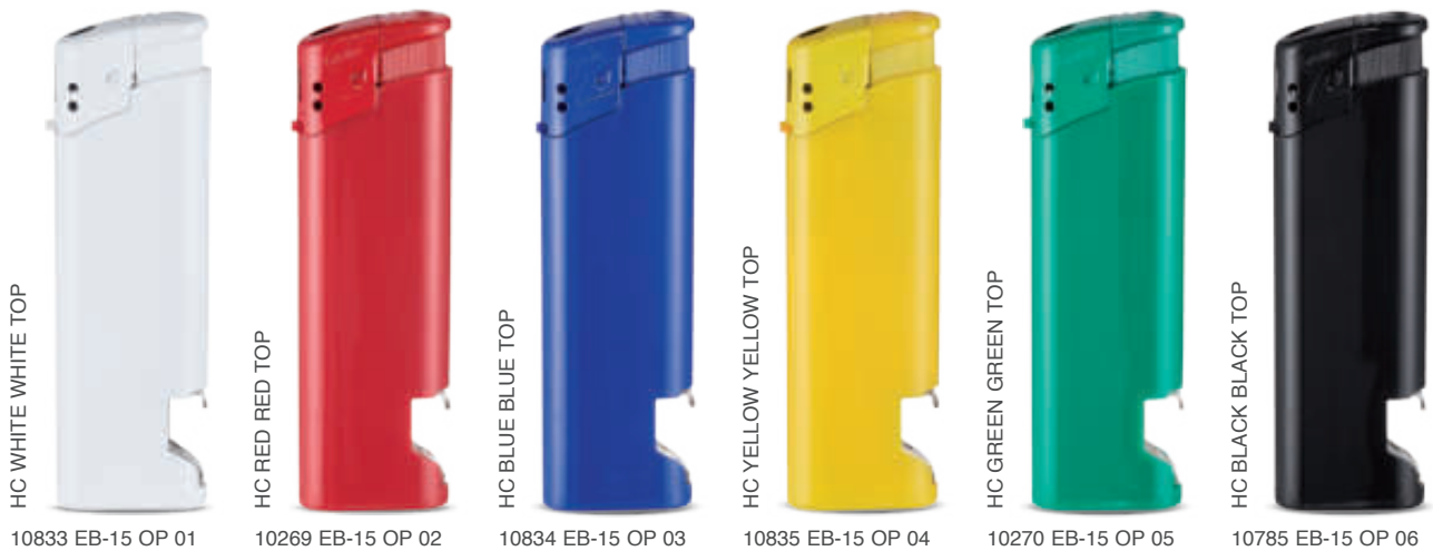
HC WHITE WHITE TOP