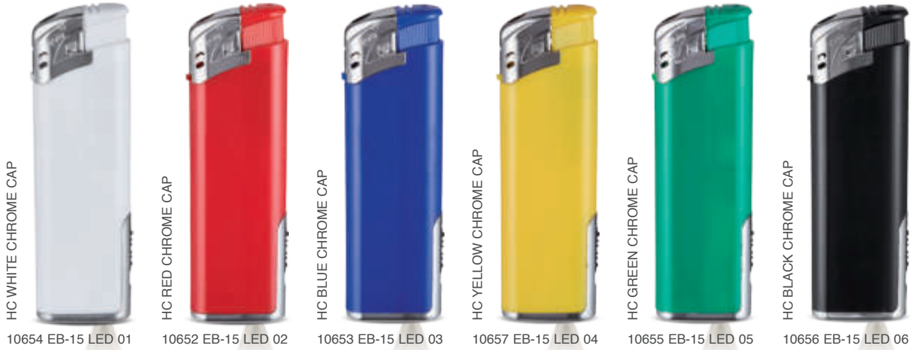
HC WHITE CHROME CAP