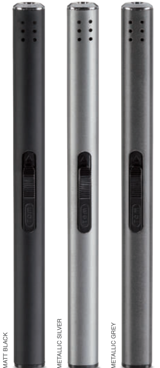
10874 BB-222 06