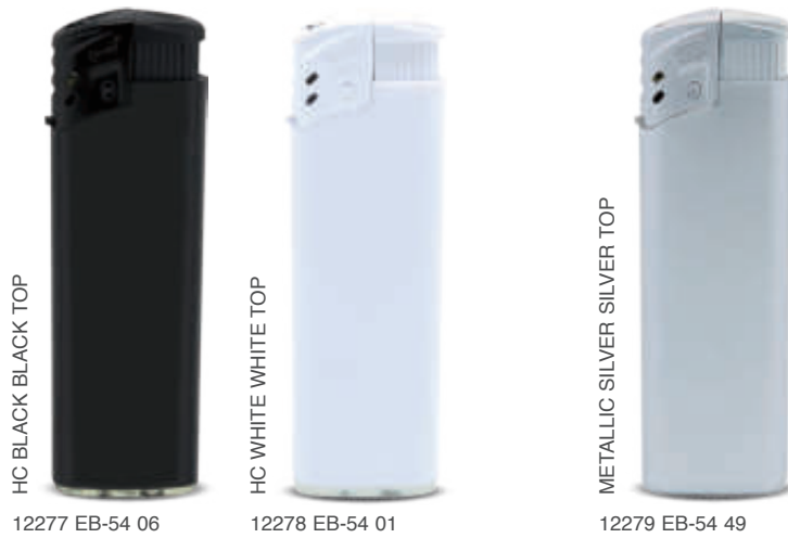
HC BLACK BLACK TOP