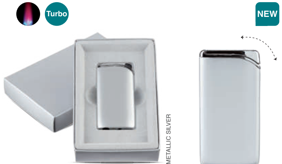
11988-01 EB-052 49