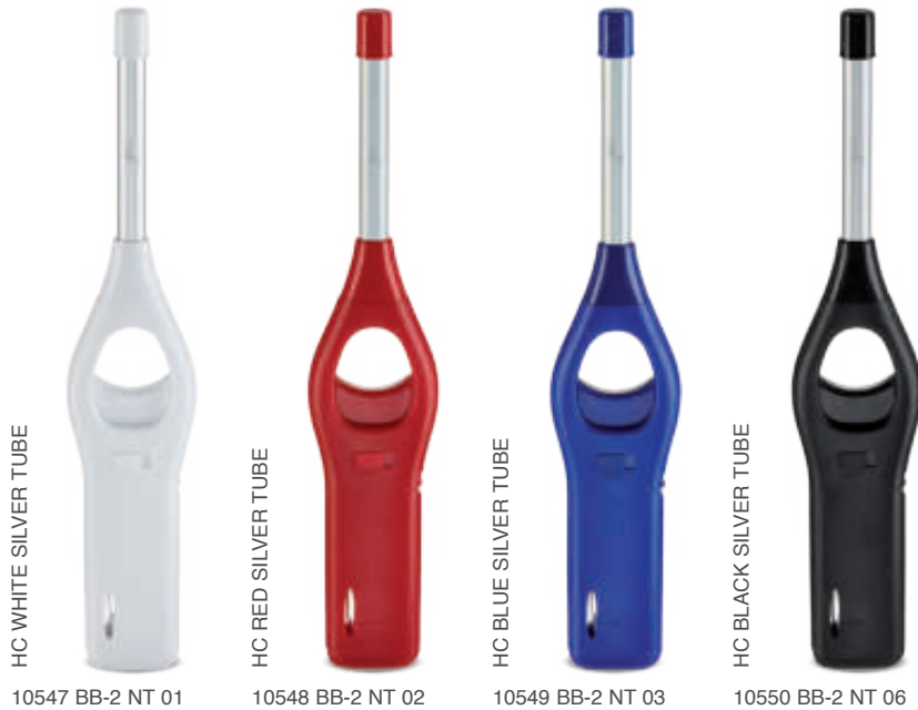
HC WHITE SILVER TUBE