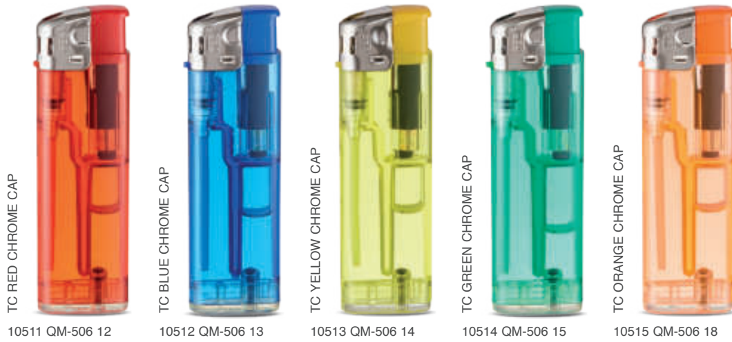
TC RED CHROME CAP