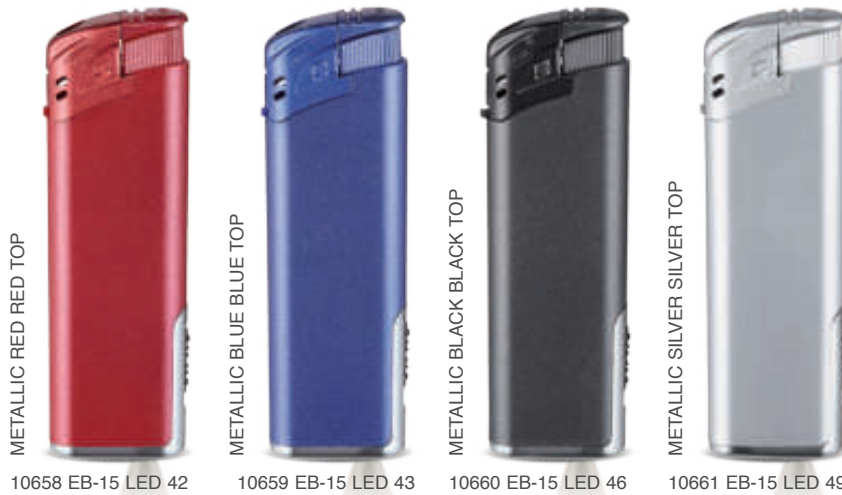
METALLIC RED RED TOP