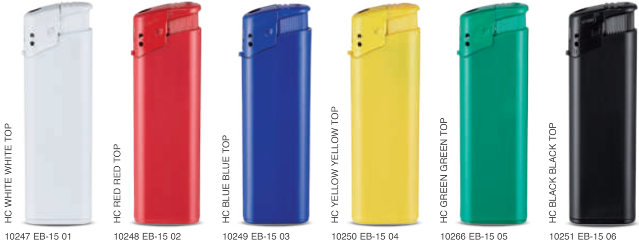
HC WHITE WHITE TOP