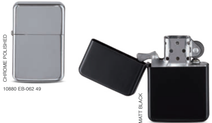
10880 EB-062 49