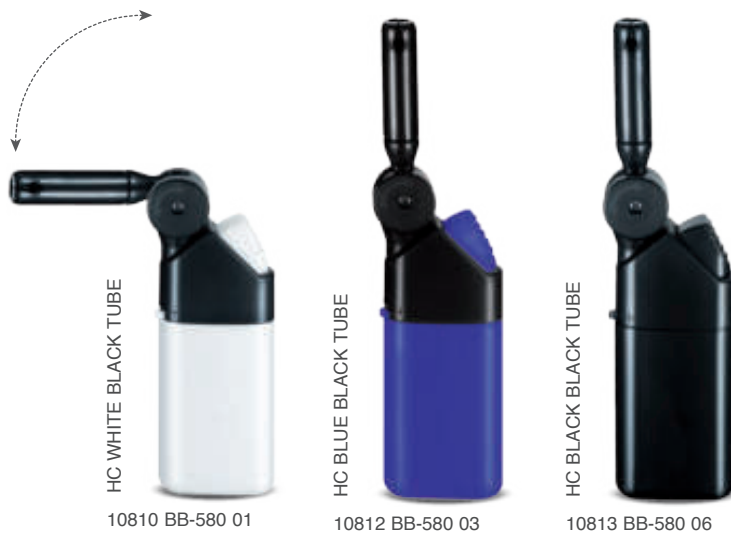
HC WHITE BLACK TUBE