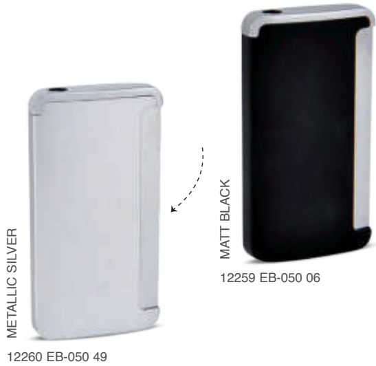
12259 EB-050 06