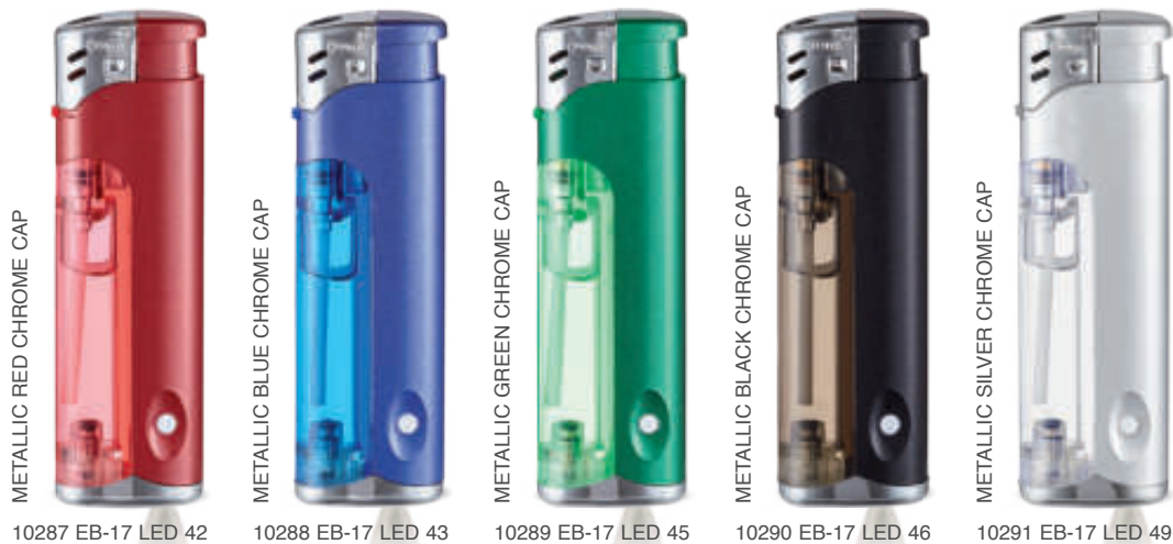
METALLIC RED CHROME CAP